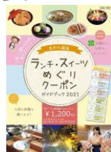
ランチ・スイーツめぐりクーポン ランチ・スイーツめぐりクーポン