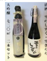
清酒 雪のしずく・雪きらら 大吟醸2本セット