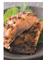
さばのへしこ ※写真はイメージです