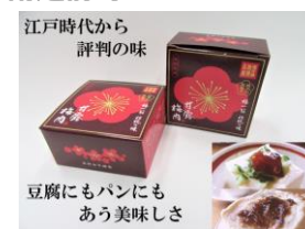
甘露 梅肉 160g×4個