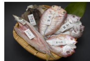
若狭高浜 季節の干物セット ※魚種は水揚げ状況によります