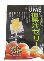
梅干し、梅ゼリーセット