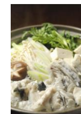
若狭ふぐでっっちりセット (3~4人前)