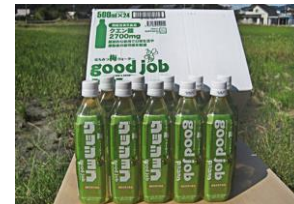
グッジョブ 12本 グッジョブα 12本 セット