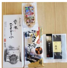
詰め合わせセット