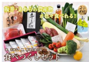
詰め合わせセット