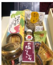
詰め合わせセット