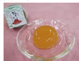
梅たっぷりゼリー 12個入り