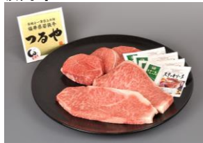
若狭牛ステーキセット