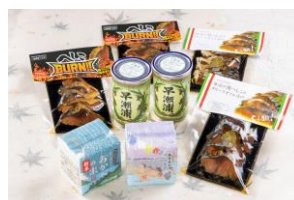
若狭美浜・ぜいたくセット