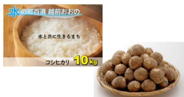
越前おおの産コシヒカリ10kgと 上庄里芋5kgのセット