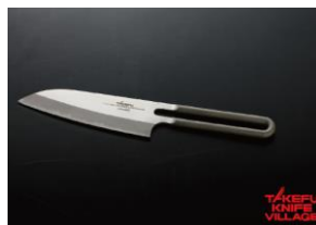
川崎和男デザイン 【クレウス13】小三徳130mm