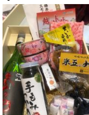
詰め合わせセット