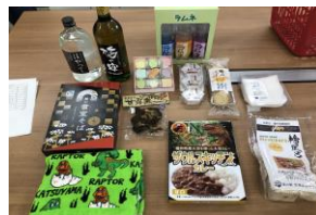
詰め合わせセット