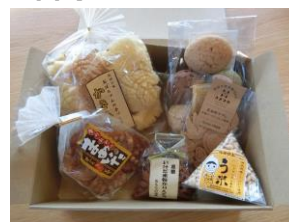
池田のこびりセット