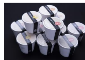
高浜たべごろアイスセット