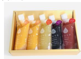
飲むゼリー詰合せ