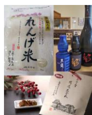
詰め合わせセット