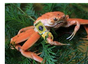
浜茹せいこがに ※写真はイメージです